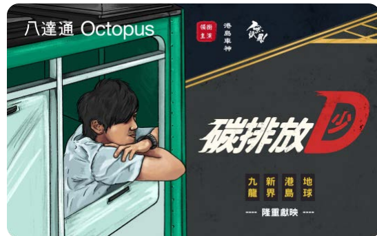
作品名稱：碳排放少 D