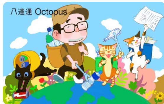
作品名稱：回收行動

於日常生活花點心思，為廢物創造更多價值！學識物盡其用，就可以將有限資源變成無限可能！