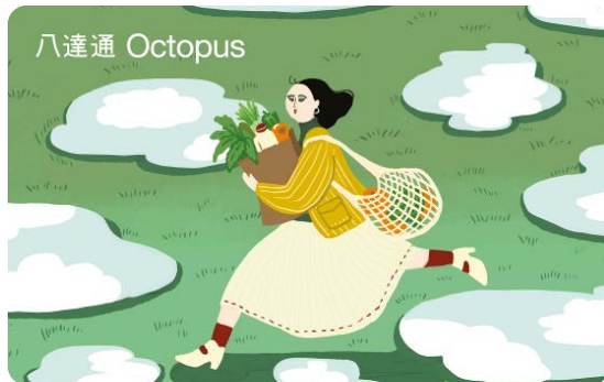
作品名稱：綠色生活的天空

平時行多啲，睇到多啲風景，仲幫到成個世界！因為每走一小步，都係走向藍天嘅一大步！