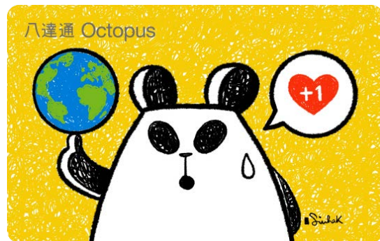
作品名稱：每日愛地球 + 1

我哋所有生物，畀幾多愛地球，地球就畀返幾多我哋。就係珍惜每一點一滴，地球先可以一直永續！