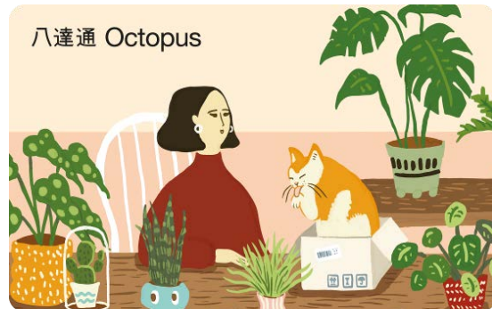
作品名稱：給自己綠色的家

平時行多啲，睇到多啲風景，仲幫到成個世界！因為每走一小步，都係走向藍天嘅一大步！