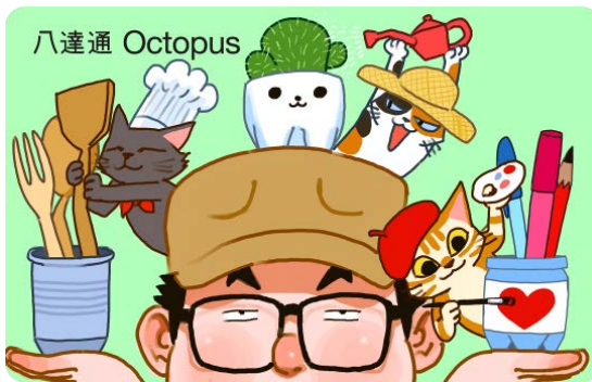
作品名稱：升級再造

於日常生活花點心思，為廢物創造更多價值！學識物盡其用，就可以將有限資源變成無限可能！