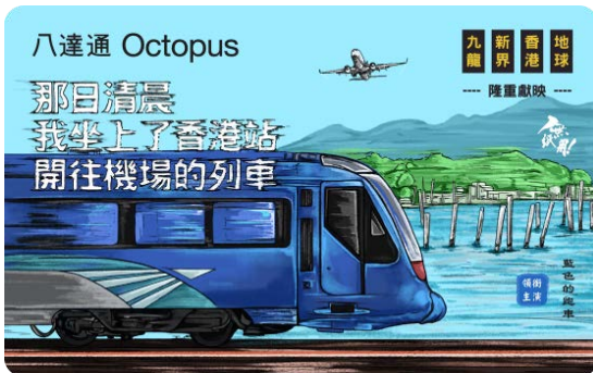
作品名稱：那日清晨