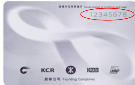
第一代租用版八達通的卡背