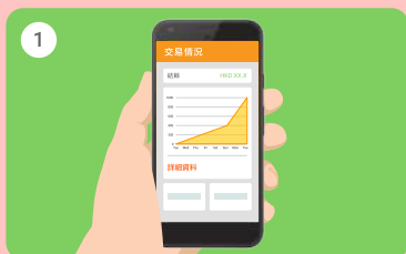
1 於主頁選取「詳細資料」