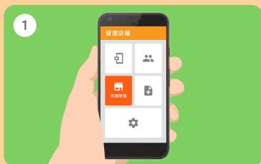
1 於主頁選取「店舖管理」