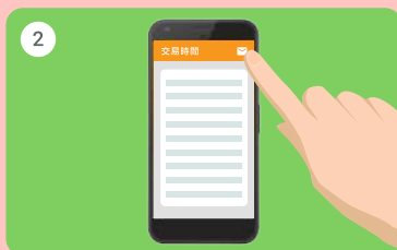
2 所有交易詳細資料將會按日期列出。 按右上角的「✉」圖像