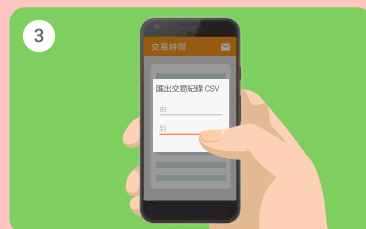
3 然後輸入日期範圍以 CSV 格式 匯出交易紀錄