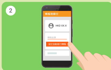
2 點選「設定自動銀行轉賬」