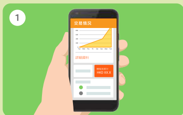
1 於主頁選取「轉賬到銀行」

店主可設定「自動銀行轉賬」，將賬戶內的所有餘額按設定要求，每月、每星期或每日自動轉賬至預設的銀行戶口，免卻人手管理及轉賬之煩惱。