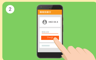
2 輸入轉賬金額，然後按「下一步」