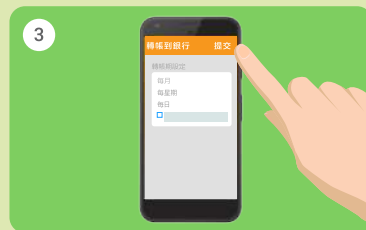
3 設定轉賬期，然後按「提交」