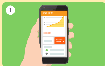
1 於主頁選取「轉賬到銀行」

商用版八達通App已結合「轉數快」，店主可24/7即時將賬戶內的收款轉賬到預先設定的銀行戶口，更靈活快捷。