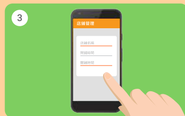
3 輸入新增店舖的名稱、開舖及 關舖時間